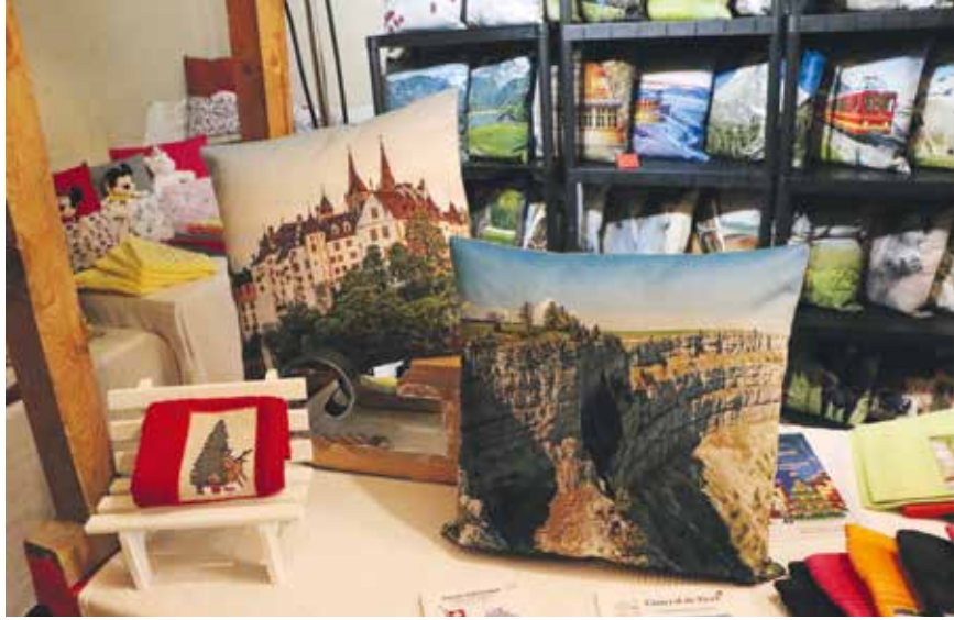
A Cernier, il y avait les coussins imprimés de Marie-Madeleine.

L'ambiance des fêtes de fin d'année se traduit avec les marchés de Noël qui foisonnent un peu partout. Si les plus réputés se trouvent en Alsace, les marchés du Val-de-Ruz sont certes de dimensions beaucoup plus modestes, mais ils permettent de découvrir la richesse de l'artisanat local. Arrêt sur image à Cernier, Landeyeux, Bayerel, ou encore Savagnier.