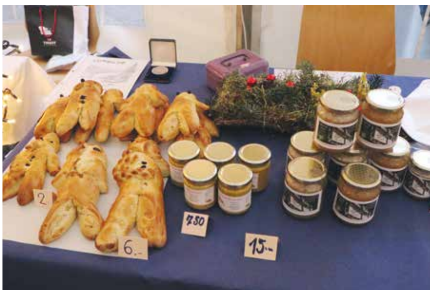
Arrêt gourmand à Landeyeux.

P'tit Marché de Noël de Dombreson, marché du Centre pédagogique de Malvilliers ou d'Evologia à Cernier: d'autres manifestations festives ont encore fleuri cette année au Val-de-Ruz, mais les délais rédactionnels font qu'il était malheureusement trop tard pour y faire un tour. /pif