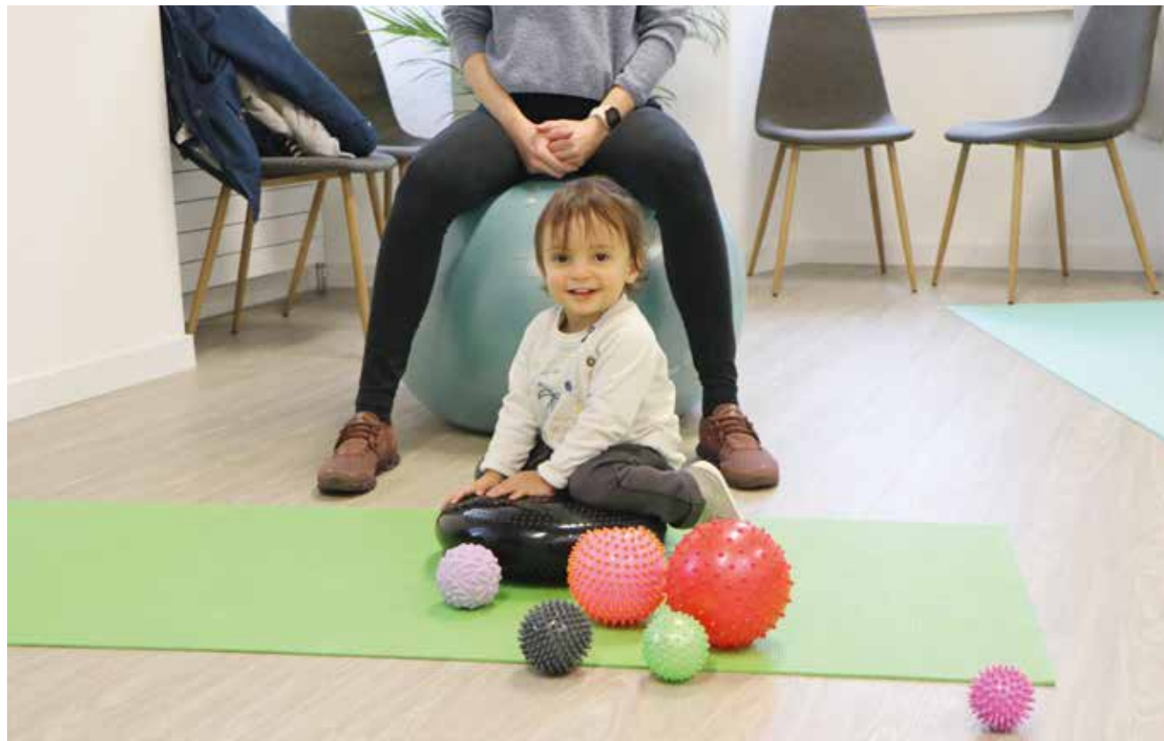
Le Centre thérapies et bien-être dispose d'une salle pour des activités communes.

Un centre médical au rez-de-chaussée et un centre pour les thérapies alternatives à l'étage: la population était invitée à découvrir le nouveau pôle santé de l'ouest du Val-de-Ruz. Ces portes ouvertes ont suscité intérêt et curiosité.