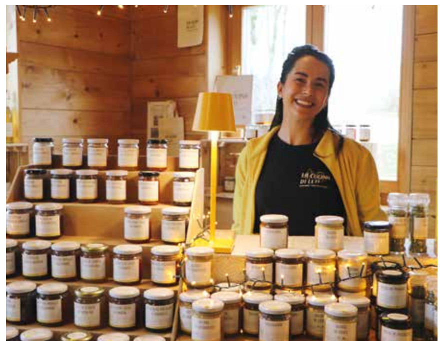
Epicerie fine à Bayerel.