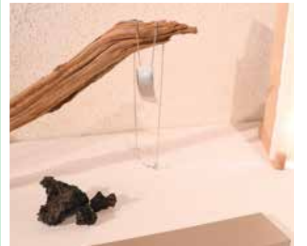
Un atelier de bijoux s'ouvre à Savagnier. (Photo pif).

Une nouvelle enseigne va voir le jour au Val-de-Ruz: «L'Atelier 611» ouvre sa boutique le 3 octobre prochain à Savagnier (place du Tilleul 1). En réalité, cet atelier de confection de bijoux est né le 6 novembre 2019, soit trente ans exactement jour pour jour après la naissance de sa bijoutière. «L'Atelier 611» fêtera sa première année d'existence, lors de la journée portes ouvertes vendredi 6 novembre 2020. A «L'Atelier 611», vous trouverez des petites séries et pièces uniques, des alliances sur mesure, et d'innombrables bijoux en argent, or ou platine au gré de vos fantaisies. /pif