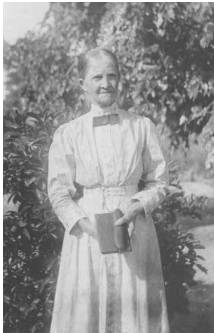
Photographie d'Elise Kiener (OAEN, Fonds Elise-Kiener).

3 Cette dernière a fait l'objet d'une nécrologie dans «Val-de-Ruz info» N° 36, en 2012.