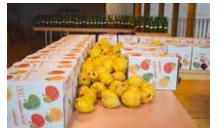
Un exemple de produits du terroir à valoriser. (photo privée).

La première assemblée générale constitutive de la Coopérative de producteurs et clients d'une plateforme de distribution au Val-de-Ruz est agendée ce mercredi 23 septembre. C'est l'aboutissement d'un long processus pour favoriser le commerce de proximité et l'agriculture locale. Ce projet collectif est notamment soutenu dans le cadre du projet de développement régional du Val-de-Ruz ainsi que par plusieurs institutions régionales: Service d'agriculture, Neuchâtel Vins et Terroir, Chambre neuchâteloise d'agriculture et de viticulture, Bio Neuchâtel et Parc régional Chasseral. On y reviendra dans notre prochaine édition. /comm-pif