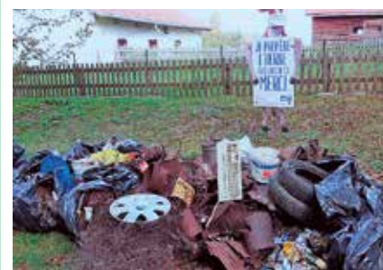
Les déchets récoltés à Chaumont. (Photo privée).

La pêche a été bonne et même fructueuse les 11 et 12 septembre à Chaumont. Et pourtant, l'inverse aurait été préférable. Après l'école, les adultes de Chaumont ont entrepris les grands nettoyages de la nature. La photo de leur récolte réalisée par Info Chaumont. /pif