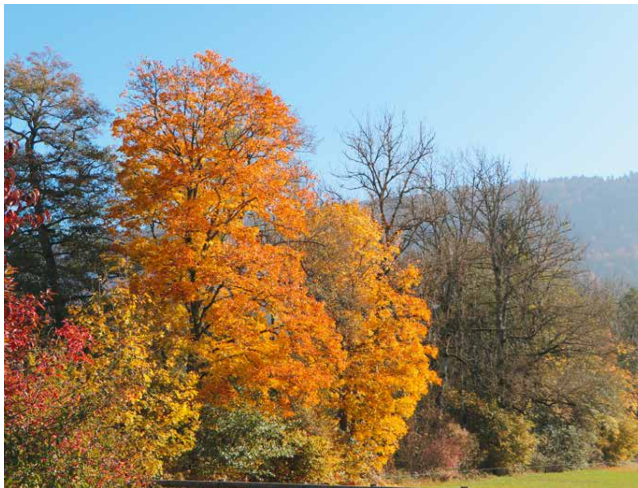
L'automne commence à frapper à la porte sur le territoire du Parc Chasseral qui s'étendra dès 2022. (Photo pif).

Fait rarissime: un ibis chauve s'est arrêté sur l'une des serres d'Evologia, à Cernier, le 2 juin dernier. Selon la liste de l'Union internationale pour la conservation de la nature, c'est l'une des cent espèces les plus menacées au monde. Il y a trois ans, on trouvait encore des populations dans le sud de l'Europe. /comm