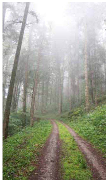
Une balade pour découvrir les mystères de la forêt.

Elle revient après huit ans de voyage autour du monde, principalement à pied, mais aussi à vélo et en bateau, soit plus de 52'000 kilomètres à travers 30 pays. Caroline Moireaux ( www.piedslibre.com ) donnera une conférence publique jeudi 24 septembre à 20h à la maison de Madame T., à Valangin. Plus d'infos: www.madamet.ch