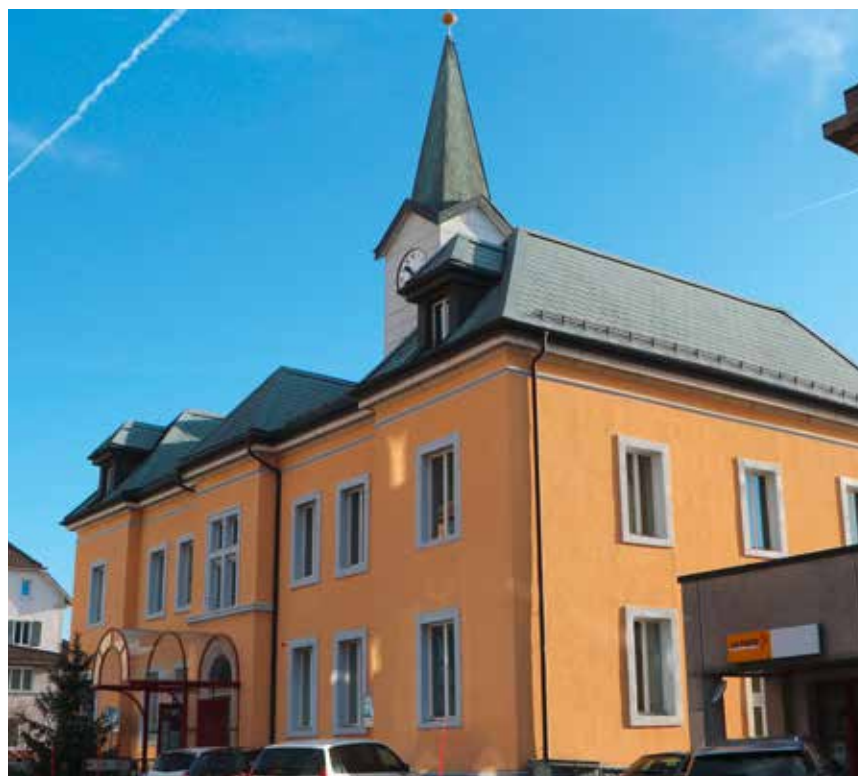
L'Hôtel communal de Cernier: siège administratif d'une commune fusionnée qui vivra ses troisièmes élections.

Les Verts - Il est prioritaire d'exploiter les friches actuelles ainsi que les zones déjà bâties et équipées. Une éventuelle nouvelle zone industrielle à Val-de-Ruz doit impérativement répondre à des critères de qualité dignes du XXI e siècle: nuisances limitées, impact paysager et écologique maîtrisé, nombre suffisant d'emplois par hectare de terrain mis à disposition et bien sûr une desserte par des transports publics à la hauteur. A ce titre, l'opportunité offerte par la future construction d'une gare ferroviaire à Cernier, à l'horizon 2035, doit d'ores et déjà être intégrée aux réflexions. /pif (PLR, PS, les Verts)