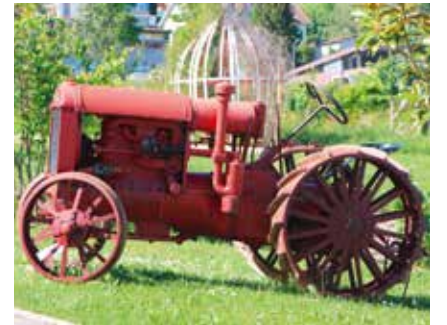
Les cours ont repris à Evologia pour les métiers de la terre. (Photo pif).

260 personnes ont repris les cours théoriques à l'Ecole des métiers de la terre et de la nature, à Cernier lors de la rentrée d'août. En chiffre par activités professionnelles, il s'agit de 73 agriculteurs, 18 fleuristes, 35 forestiers-bûcherons, le restant concerne les différentes spécialisations en horticulture. /comm