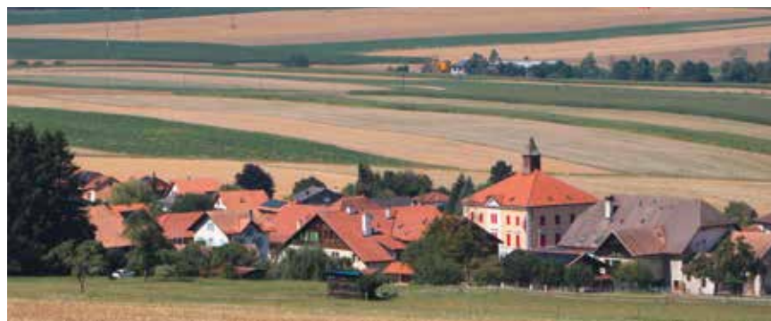
Le Val-de-Ruz, une commune à vocation rurale.

Il reste à découvrir ce qu'il ressortira des urnes. /pif