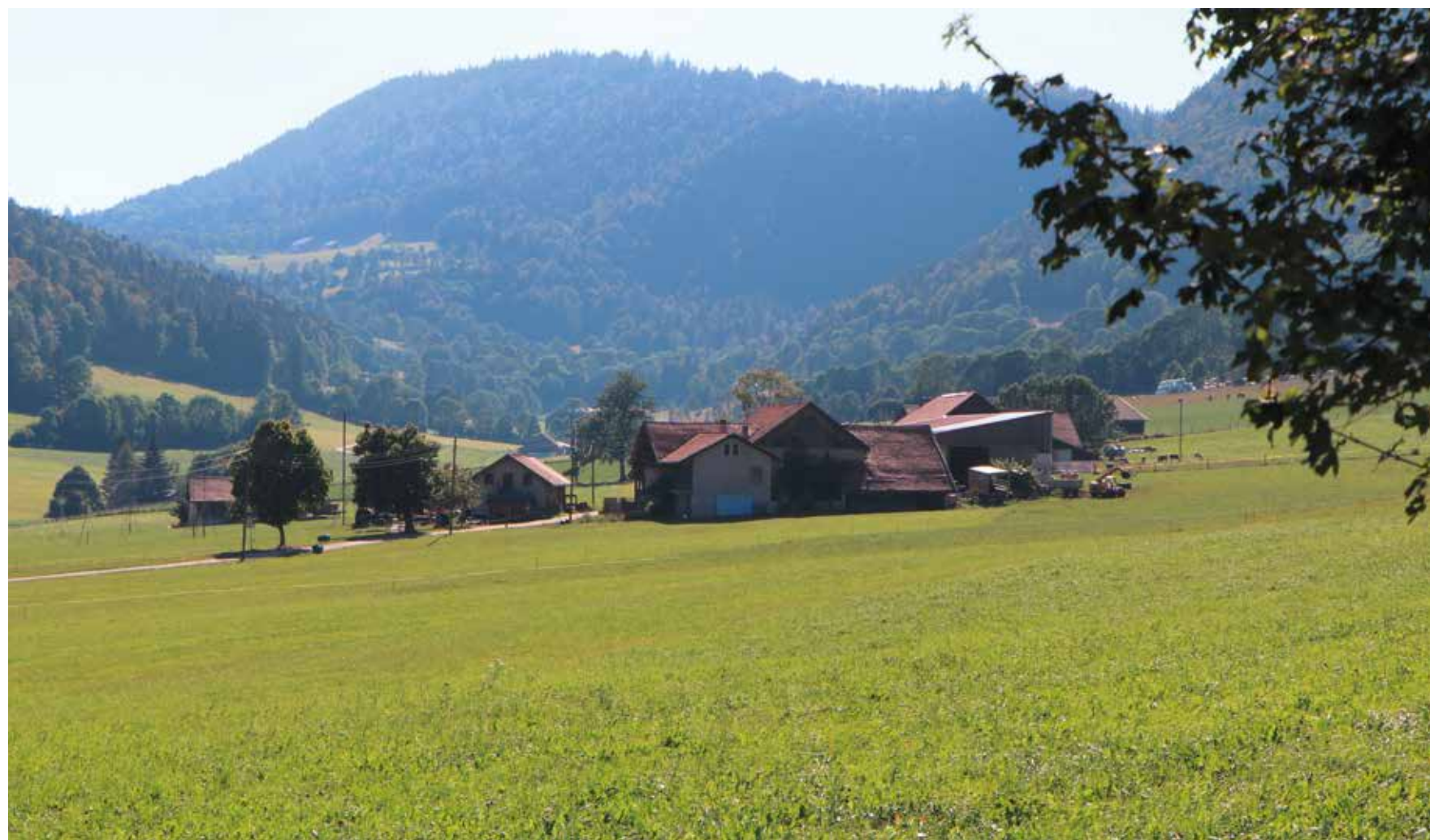
Le Val-de-Ruz et ses paysages verdoyants: l'entier de son territoire devrait bientôt être intégré au Parc Chasseral. (Lire en page 5). (Photo: pif).